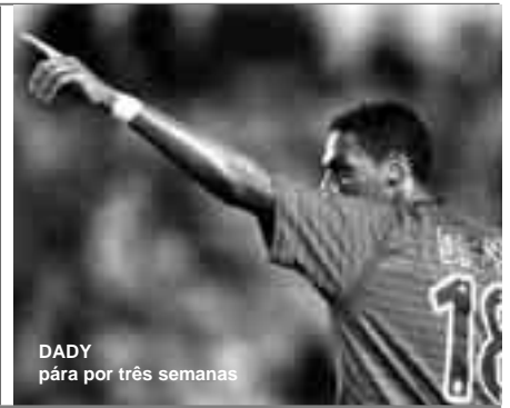
DADY pára por três semanas