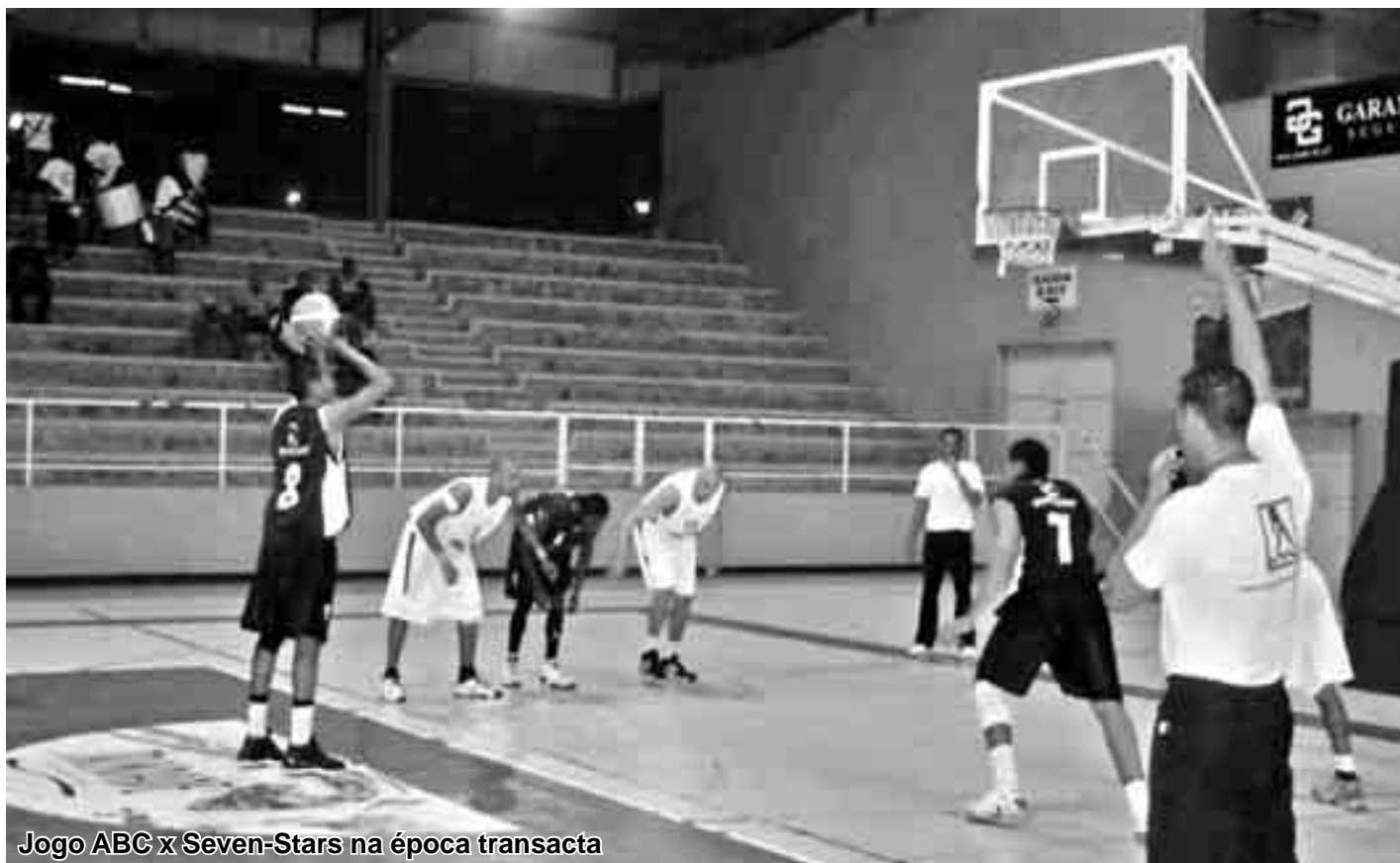
Jogo ABC x Seven-Stars na época transacta