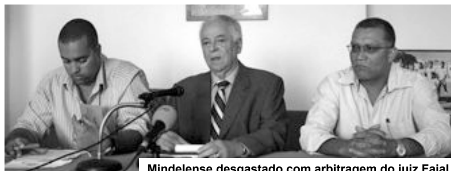
Mindelense desgastado com arbitragem do juiz Faial

Ainda na Boa Vista, também em Janeiro, começa a segunda e última fase das obras de construção do pavilhão desportivo da zona de Monte Sossego Trás, na Vila de Sal-Rei. O projecto completo está orçado em 68 mil contos, devendo ser gastos nesta segunda fase 27 mil contos.