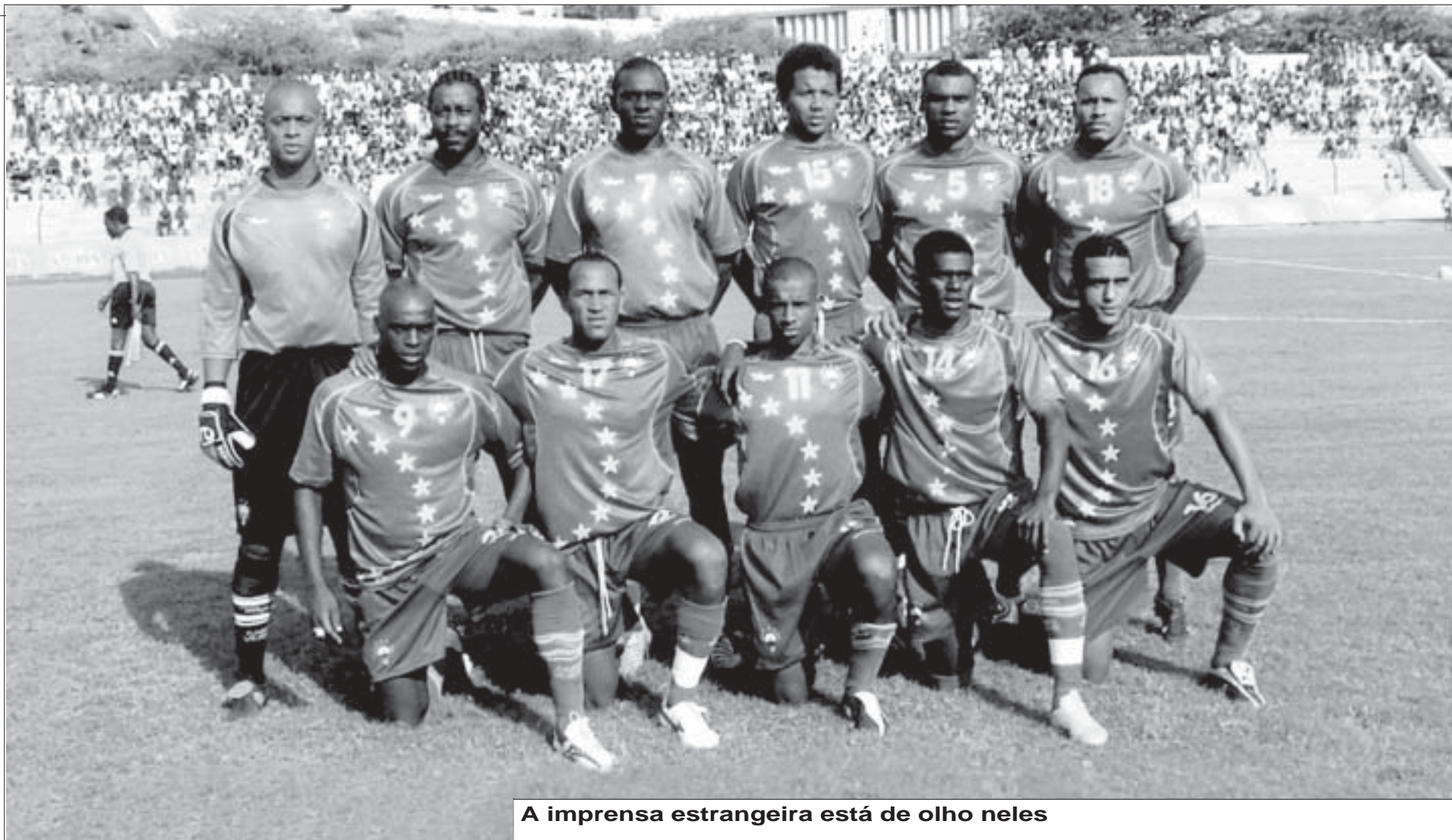
A imprensa estrangeira está de olho neles