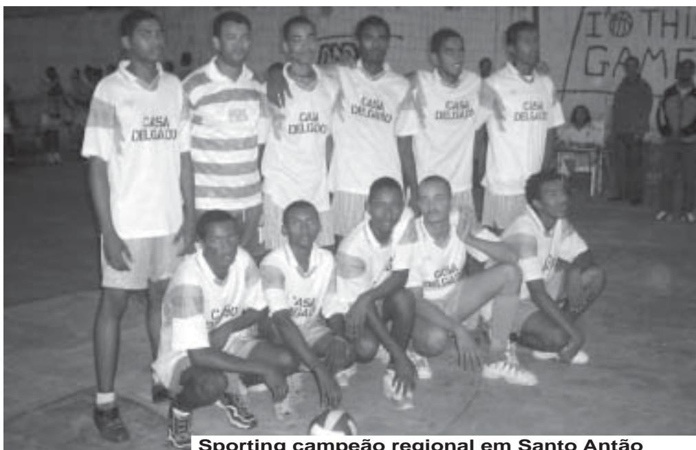
Sporting campeão regional em Santo Antão

Os seniores masculinos do Sporting do Porto Novo apuraram-se também para o nacional da modalidade, depois de vencerem o regional de Santo Antão no último fim-de-semana. Os “Leões” derrotaram o Paulense por três sets a zero na terceira partida dos Playoffs e sagraram-se campeões regionais da ilha das montanhas pela primeira vez na sua curta história.