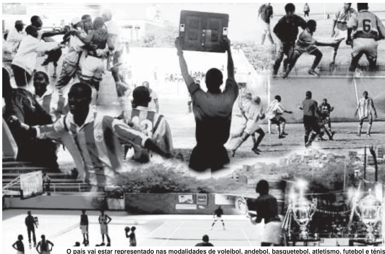
O país vai estar representado nas modalidades de voleibol, andebol, basquetebol, atletismo, futebol e ténis