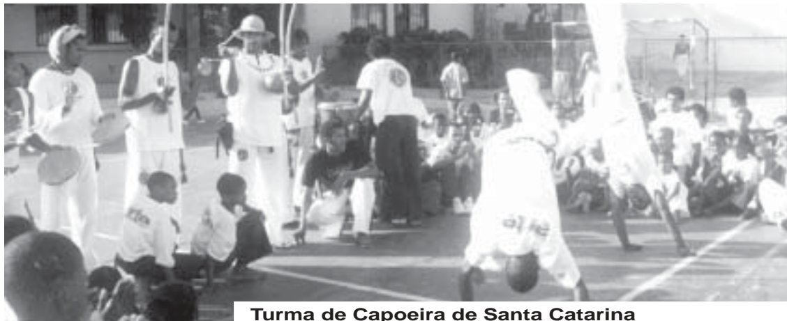
Turma de Capoeira de Santa Catarina

Termina amanhã o 1º encontro infanto-juvenil de capoeira em São Vicente, em que participam cinco crianças da Aldeia SOS de Assomada. "Promover uma semana de actividades com as crianças e jovens que fazem parte da associação de capoeira 'Liberdade e Expressão' no sentido de fortalecer os laços de amizade, fraternidade e companheirismo dos mesmos" aparece como o propósito fundamental da reunião desses capoeiristas na ilha do Porto Grande.